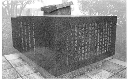
慶應義塾発祥の地記念碑 築地鉄砲州(現明石町)中津藩中屋敷跡 150年の歴史の中で、慶應義塾の「独立」と「実学」の理念は脈々と受け継がれ、財界、政界はもとより、音楽界にも多数の人材を輩出してきた。

慶應讃歌グランドコンサートは各音楽団体のOB、OG、塾ゆかりの音楽家を中心とした豪華出演者陣に加え、現役の応援指導部からも登場。総出演者450人、3時間に及ぶ大音楽会です。